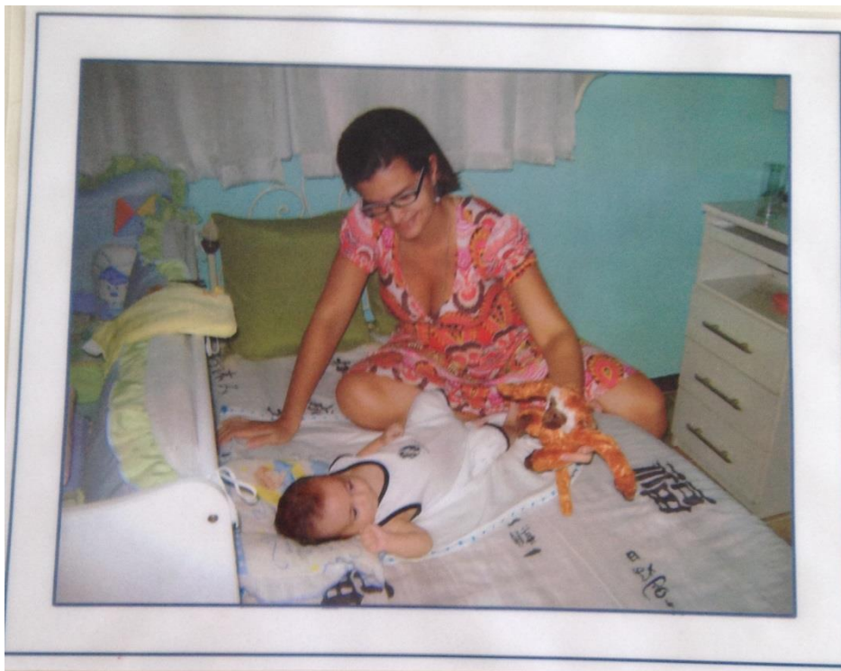
Estimulação por objeto